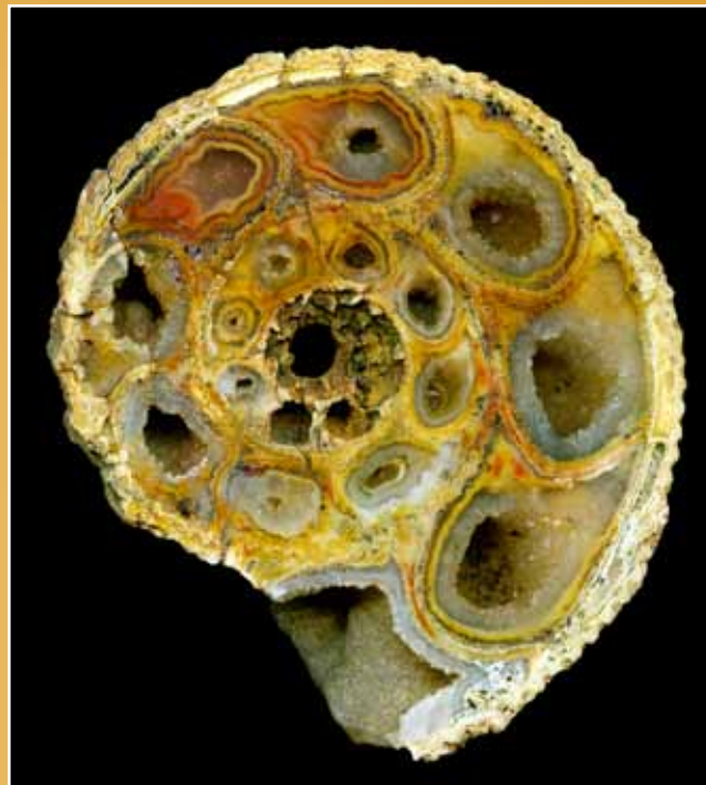
Amonit z kwarcem i chalcedonem. Jura Krakowsko-Częstochowska. MG nr 10143, 85 x 75 x 30 mm.