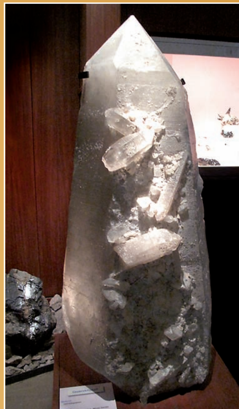
Kwarc – Diamantina, Minas Gerais, Brazylia. 320 kg. Muzeum Mineralogiczne, Uniwersytet Hamburg, Niemcy.